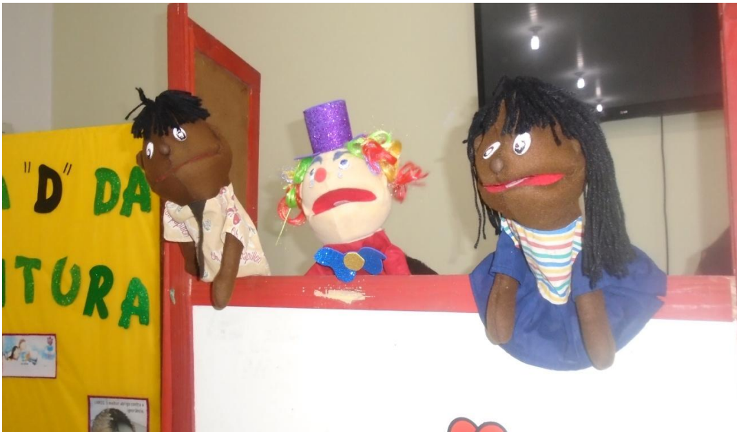
Figura 05: apresentação dos estudantes com fantoches.

estavam ansiosos, mas preparados para mostrar o que aprenderam nas aulas de teatro. As duas turmas se apresentaram começando com pessoas em cena e no meio da história incluíram a peça com os fantoches para dar continuidade e finalizando a peça teatral. Segue imagem de um dos cenários usados para apresentação com fantoches.