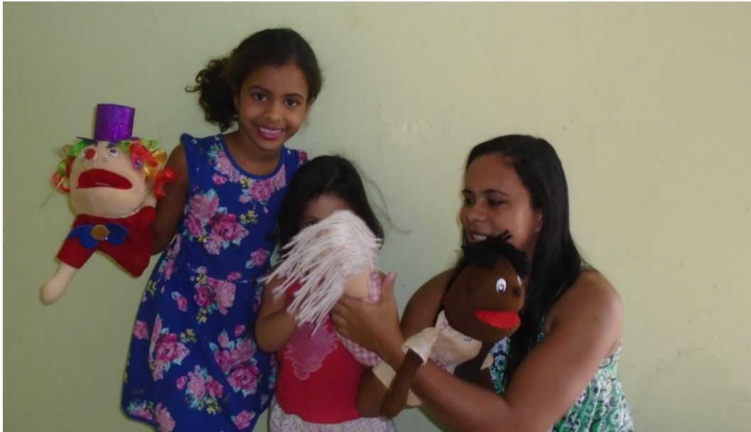
Figura 04: crianças manipulando fantoches