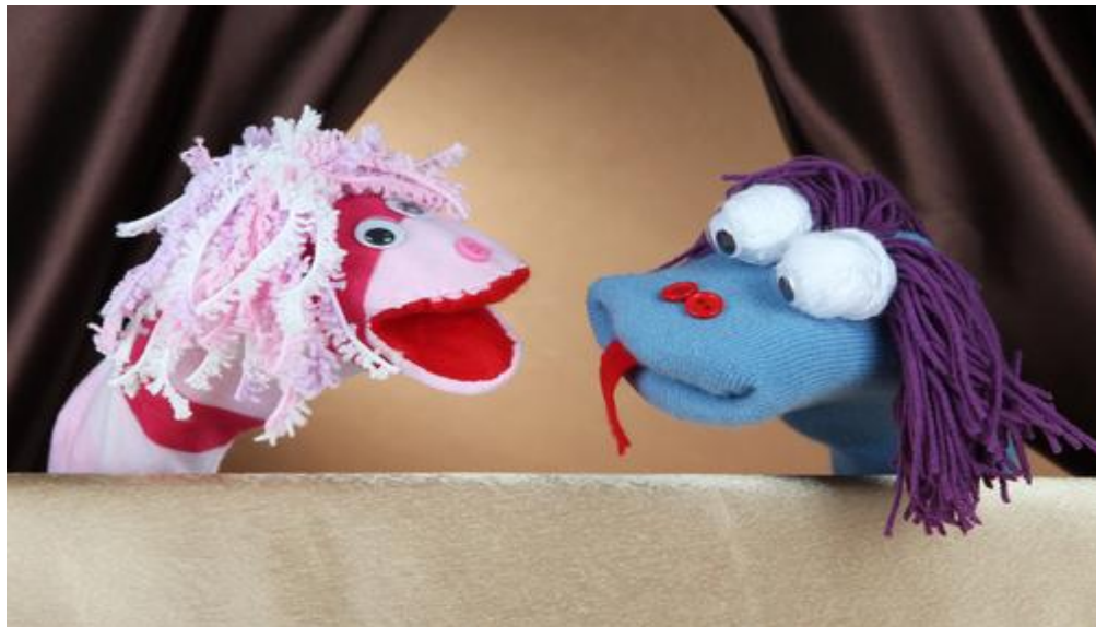
Figura 02: personagens de fantoches feito de meias