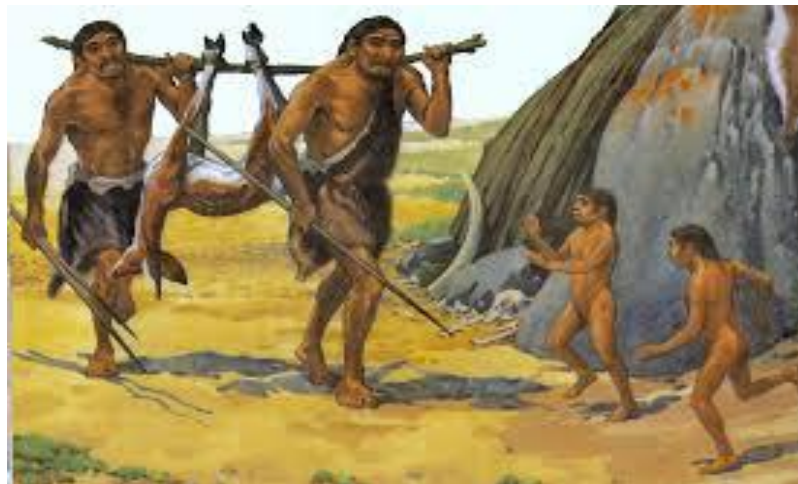
Figura 01: Homens na pré-história voltando da caça